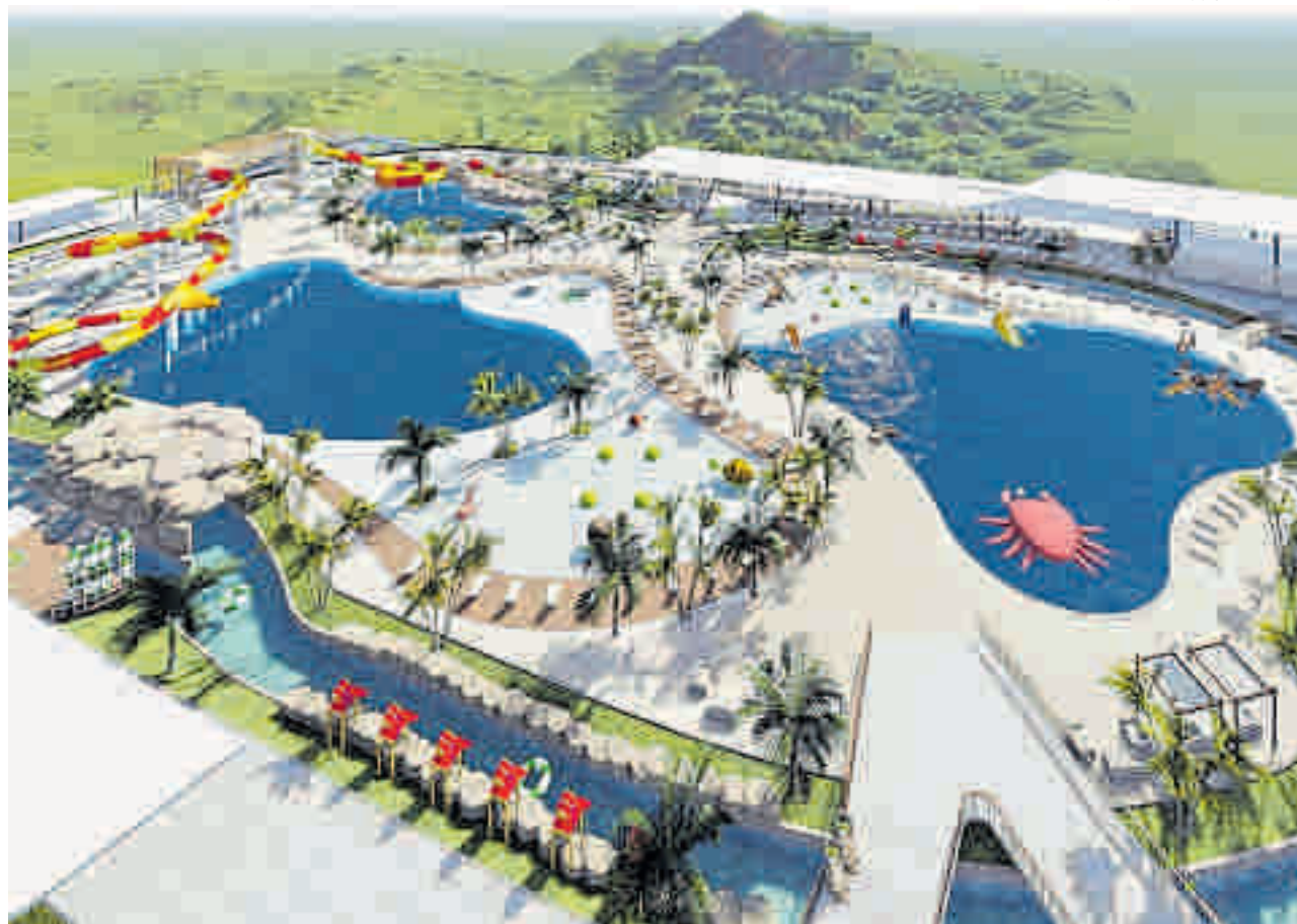
Esta es una maqueta de lo que sería la zona recreativa de la sede de Comfenalco Santander que se construirá en el embalse Topocoro.