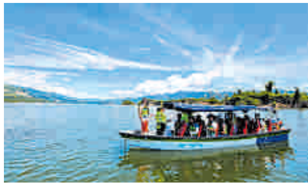
En el embalse ya se realizan actividades turísticas en lanchas.

La obra, la primera de esta magnitud que se empezará a construir en el Topocoro, ya cuenta con los diseños y se adelantan los ajustes para arrancar con